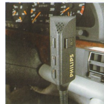
beide Hände am Lenkrad behalten können. Freisprecheinrichtung