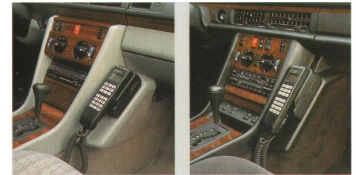
200 D-300 E/CE/TE-500 E 300-600 SE/SEL

Das Motorola Autotelefon CM 451 ist von der Einbaulage des Bedienhandhörers exakt auf die verschiedenen Mercedes-Benz Baureihen zugeschnitten. Besonderen Wert jedoch haben die Mercedes-Benz Ingenieure auf einen wichtigeren Aspekt gelegt. Das Autotelefon wurde so platziert, daß die Sicherheit des Fahrers und Beifahrers in jeder Situation gewährleistet ist.