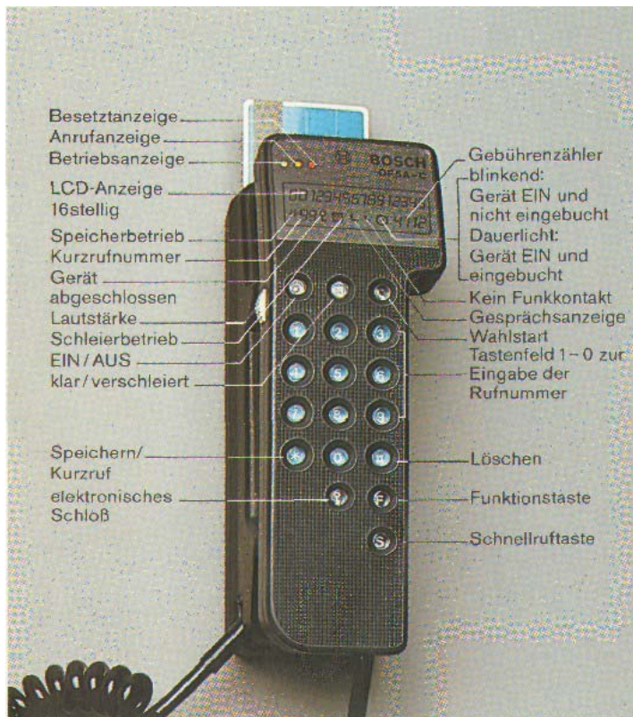
Was das neue Autotelefon alles zu bieten hat.

Das kommt dabei heraus, wenn man ebensoviel von Funk wie von Automobiltechnik versteht: das Autotelefon OF 5 von Bosch